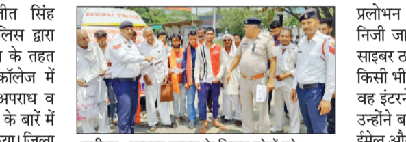
पानीपत। साइबर क्राइम के विरुद्ध लोगों को जागरूक करते हुए पुलिस टीम।