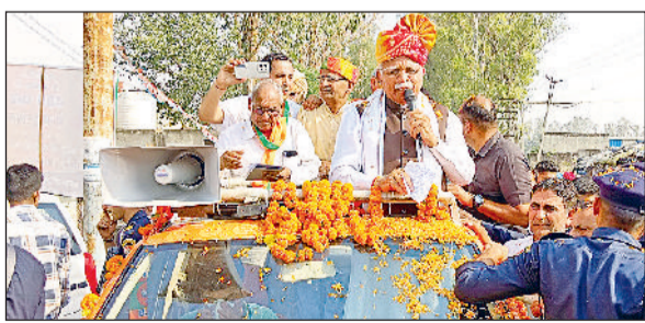
इंद्री के गांव खेड़ा मे रोड निकालते पूर्व मुख्यमंत्री मनोहर लाल ।