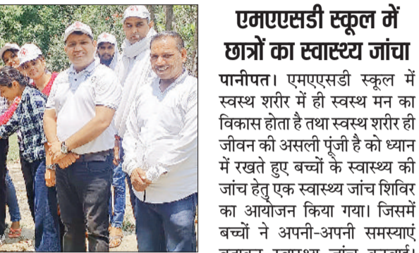
पौधे रोप कर मनाया विश्व रेडक्रॉस दिवस

प्रलोभन या विश्वास में आकर अपनी कोई भी निजी जानकारी किसी के साथ सांझा ना करें। साइबर ठगों के निशाने पर हर वह आदमी है, जो किसी भी डिजिटल माध्यम से जुड़ा है। फिर चाहे वह इंटरनेट मीडिया हो या फिर इंटरनेट बैंकिंग। उन्होंने बताया कि अक्सर इंटरनेट यूजर को ऐसे ईमेल और मैसेज आते रहते हैं, जिन पर अनजान लिंक मौजूद होते हैं। ऐसे में हमें इन ईमेल और मैसेज से सावधान रहना चाहिए और हमें इन ईमेल और मैसेज में मौजूद अनजान लिंक पर कभी भी क्लिक नहीं करना चाहिए। कभी भी किसी भी वेबसाइट को विजिट करते समय सबसे पहले एचटीटीपीएस पर ध्यान देना चाहिए।