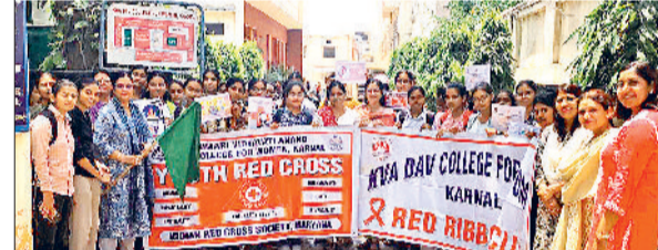
करनाल। विश्व रेडक्रास दिवस कार्यक्रम में भाग लेते विद्यार्थी।

कुमारी विद्यावती आनंद डीएवी महिला महाविद्यालय में भारतीय रेड क्रॉस सोसाइटी हरियाणा राज्य शाखा और युवा रेड क्रॉस कुरुक्षेत्र विश्वविद्यालय के दिशा निर्देशों और आदर्शों का पालन करते हुए युवा रेड क्रॉस और रेड रिबन क्लब द्वारा विश्व रेडक्रास दिवस समारोह का आयोजन किया गया। रेडक्रॉस के मानवीय आदर्शों को समर्पित विभिन्न गतिविधियों का आयोजन किया गया। सर्वप्रथम रेडक्रॉस गान व क्लेप के साथ कार्यक्रम का