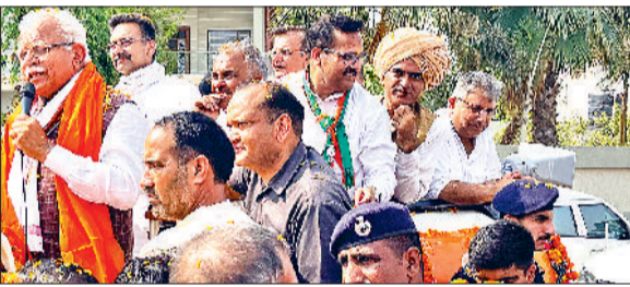
तरावड़ी। जी टी रोड पर भाजपा प्रत्याशी मनोहर लाल खट्टर का स्वागत करते लोग।

इंझाड़ी शामाढ़ से जाते समय गांव तखाना तरावड़ी जी टी रोड पर लोगों से किया स्वागत