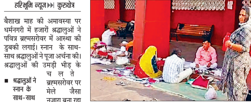
कुरुक्षेत्र। अपने पितरों के नामित पिंडदान करवाते श्रद्धालु व ब्रह्मसरोवर में डुबकी लगाते श्रद्धालु।