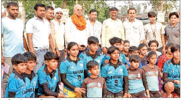
पानीपत जिला स्तरीय कबड्डी सब जूनियर प्रतियोगिता के विजेता, अतिथियों के साथ।

हरिभूमि न्यूज पानीपत हरियाणा एमेच्योर कबड्डी एसोसिएशन के तत्वावधान में नंबरदार खेल समिति द्वारा मंगलवार को गांव डाहर में जिला स्तरीय सब जूनियर कबड्डी प्रतियोगिता लड़कों व लड़कियों का आयोजन किया गया। प्रतियोगिता में लड़कियों में गांव डाहर की टीम प्रथम, राजाखेड़ी की टीम द्वितीय व गांव हड़ताडी व बुडशाम की टीमों तीसरे स्थान पर रही। जबकि लड़कों में गांव धनसौली की टीम प्रथम, नौल्था की टीम द्वितीय व गांव बापौली व बुडशाम की टीमों तीसरे स्थान पर रही। प्रतियोगिता के समापन