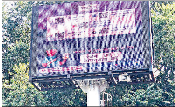
लोगों को मतदान के प्रति जागरूक करने के लिए लगाई गई एलईडी स्क्रीन।

प्रशासन ने मतदाताओं को जागरूक करने के लिए लोकसभा क्षेत्र में लगाए पलैक्स, 100 पीसीटी मतदान करवाने के लक्ष्य को पूरा करने का होगा प्रयास