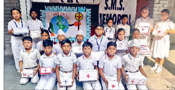
तरावड़ी। स्कूल में बनाये गए प्राथमिक चिकित्सा बाक्स के साथ छात्र।