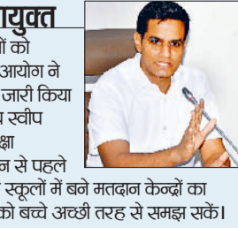
चल रहे कई कार्यक्रम: उपायुक्त